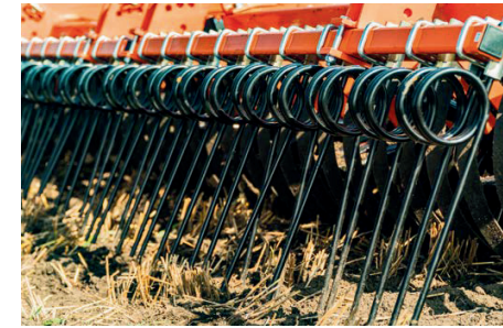
Rugós egyengető pálcasor henger után