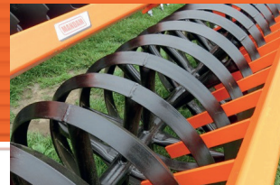
Ékgyűrűs henger ø 600 mm