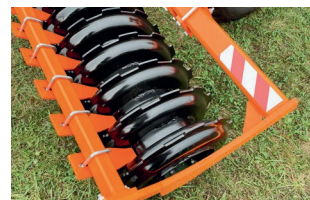
DD henger ø 600 mm