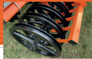
C-gyűrűs henger ø 600 mm