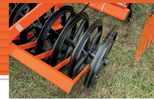
T-gyűrűs henger ø 600 mm