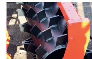
Packer henger ø 600 mm