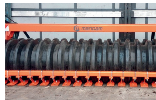
Gumihenger ø 500 mm