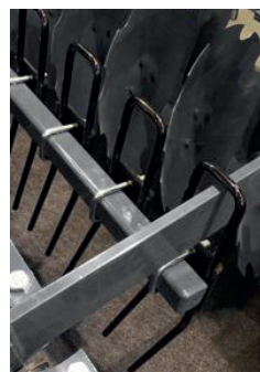
Pálcasor tárcsasor között