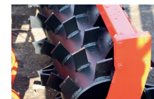
Packer henger ø 600 mm