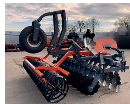
Skorpio transzportkerék (3,5m-ig)