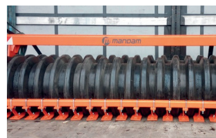
Gumihenger ø 500 mm