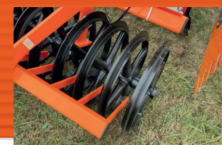
T-gűrűs henger ø 600 mm