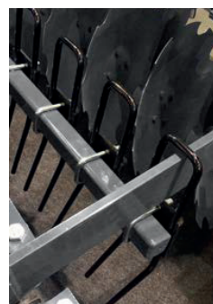
Pálcasor tárcsaszár között