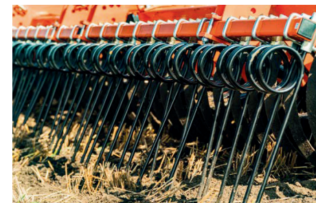
Rugós egyengető pálcasor henger után