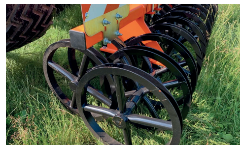
C-gűrűs tandem henger ø 600 mm