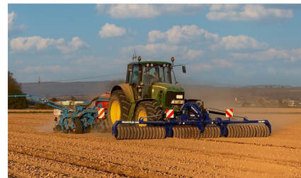
FRONT PRESSES 150-600