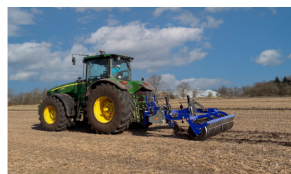
SUBSOILER M Profi

DALBO A/S, Bindeballevej 69, DK-7183 Randbøl Tel.: +45 75 88 35 00, info@dalboagro.com, www.dalboagro.com