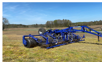
MAXIROLL GREENLINE 630-830