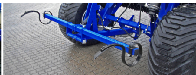
Kelés előtti nyomjelzők