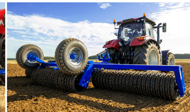
4. A gép úszó helyzetbe kerül és munkára kész.