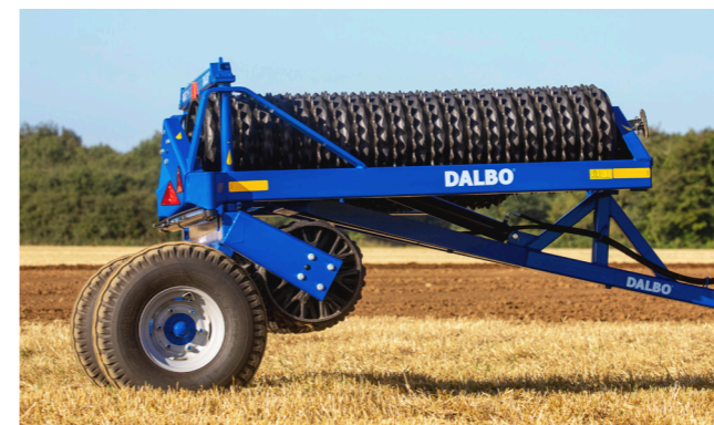
1. A tagok kiemelkednek a zárt szállítási helyzetből.