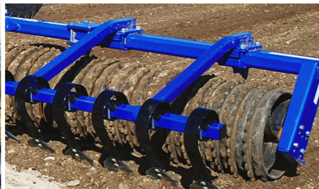
Hidraulikusan állítható simítóval felszerelve