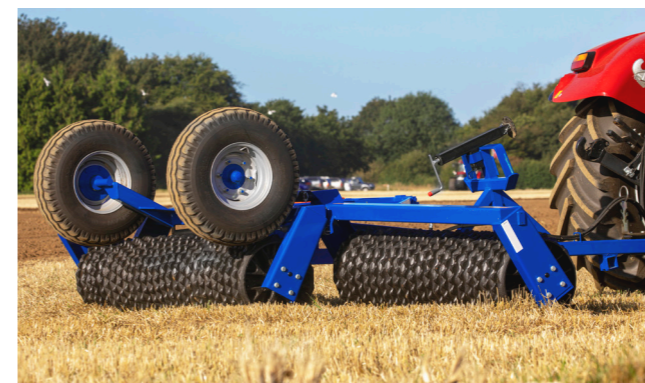
3. A hengertagok munkahelyzetbe süllyednek, és a kerekek automatikusan felemelkednek.