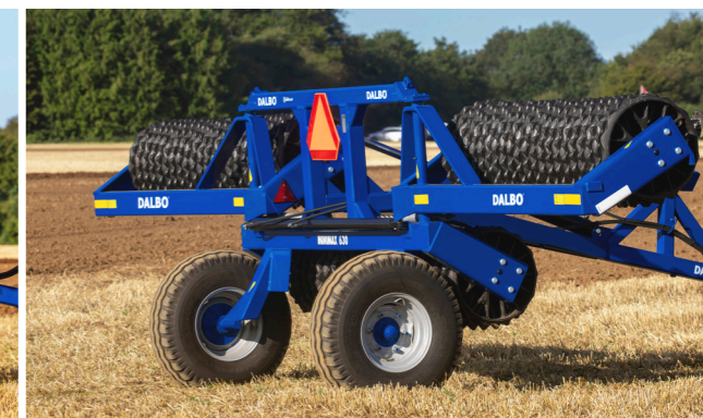
2. Az oldalsó tagok szétnyílnak.