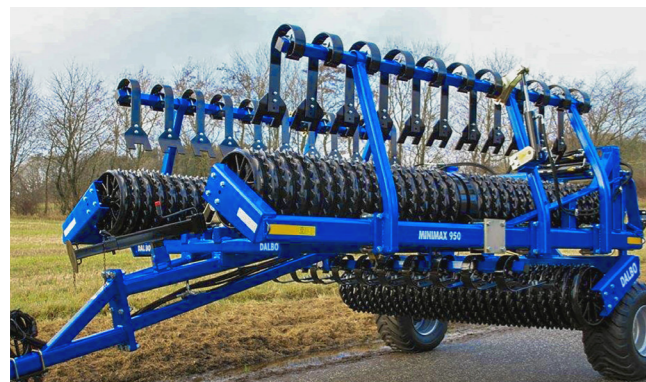
A MINIMAX simítóval felszerelve szállítási helyzetben

a simító hidraulikusan felemelhető, ami növeli a használhatóságot és a sokoldalúságot. A simító egy extra kettős működésű hidraulikus kört igényel a traktoron. Optimális munkakörülmények között 8-10 km/h munkasebességet javasolunk.